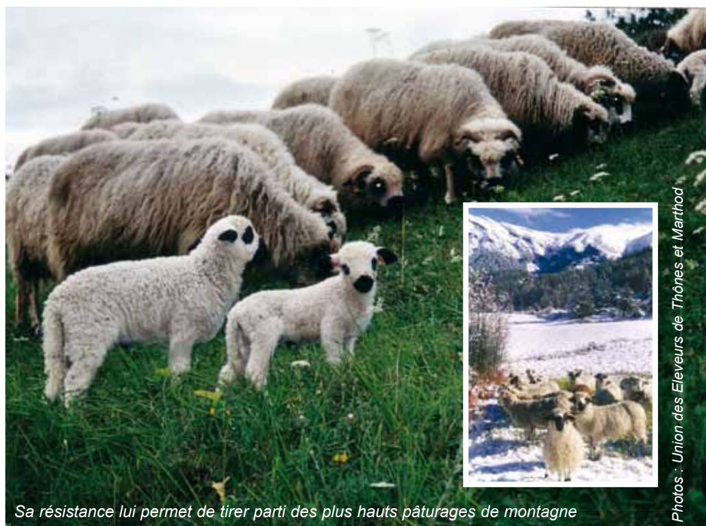
Sa résistance lui permet de tirer parti des plus hauts pâturages de montagne

Dans tous les cas, ces animaux, d'une docilité et d'un calme remarquable, utilisent et entretiennent l'espace montagnard et les zones extensives.